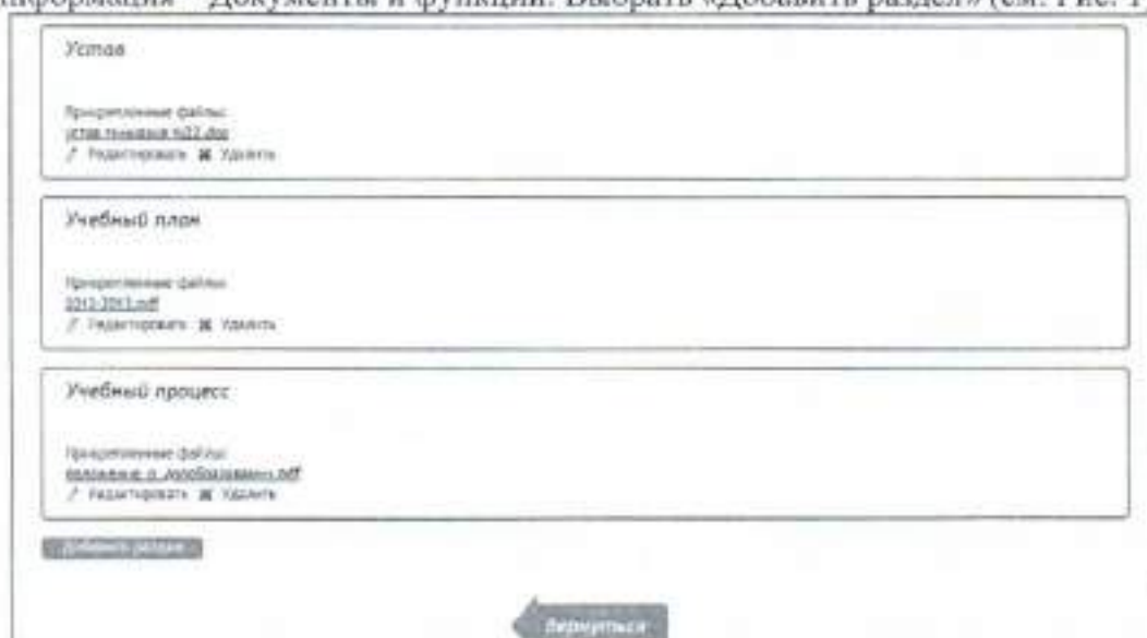
Рис. 1. Добавление нового раздела.

1. На странице школы перейти в Редактировать данные – Общая информация – Документы и функции. Выбрать «Добавить раздел» (см. Рис. 1)